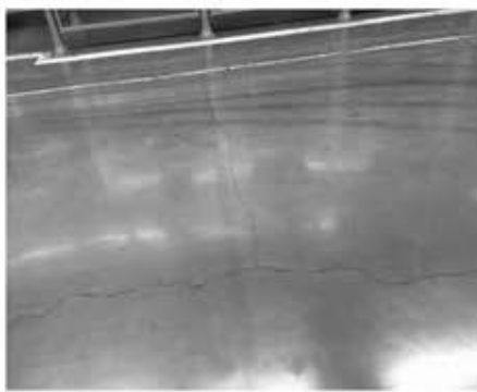
图 地坪砼厚度不均造成的裂缝

工程施工中，有的施工单位对地坪基层的标高重视不够，控制不严，造成地坪砼的厚度不均。也有的地坪砼浇筑方法不科学，一味的追求简单方便，砼泵车在地面基层反复碾压，造成地面基层局部隆起，砼浇筑到此位置时，又没人采取平整措施，造成地坪厚度存在明显差异，在砼收缩应力的作用下，就会在地坪厚度有明显变化的地方造成裂缝。