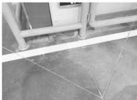
图 切割成菱形的实际施工图片

柱周围菱形缩缝，可以后浇留置，也可以与地面一起浇筑后进行切割成形，但要求切割深度至少需 8cm 以上，才可能消除裂缝的产生。