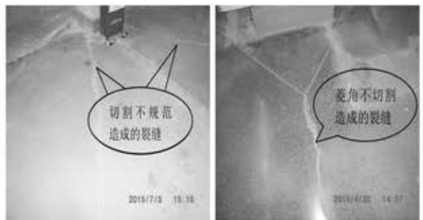
左图 切割深度不规范造成的裂缝实例 右图 菱形角部的裂缝实例