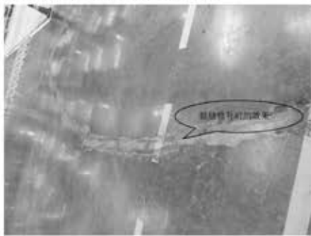
图 裂缝修补后观感效果依然不理想

混凝土地坪裂缝一旦出现,往往很难修复。就算勉强将裂缝填嵌密实,但修复后的地面仍然会留下痕迹,就象光滑的皮肤上留下一条伤疤一样,无法改变因裂缝造成地面观感质量下降的客观情况。