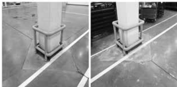
图 菱形后浇法实际施工图片

在地坪大面浇筑砼前，先将柱四周用模板支成菱形，不与地坪大面砼一起浇筑，等后续浇筑砼。不足之处是，若采用耐磨地坪，此处不能与地面地坪一起打磨，颜色与其它地坪就存在差异，影响观感。