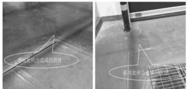
左图 没有切缝引导应力，基坑角部造成的裂缝 右图 基坑角部应力造成的裂缝

下面两图是从应力集中起点（90 度角处）至基坑壁边处缩缝或纵横向缩缝的切缝，消除了应力集中，没有出现不规则裂缝。