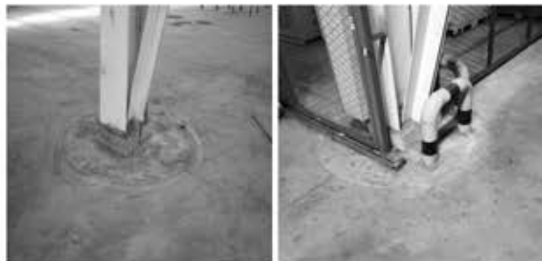
左图 刚施工完的圆形后浇法图片 右图 已投入使用的圆形后浇法图片