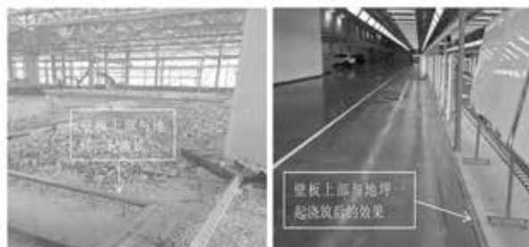
左图 设备基坑周围地面浇筑前图片 右图 基坑周围地面成型后的图片