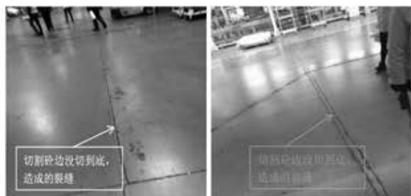
图 切割不彻底裂缝实例 修边切缝不彻底造成的裂缝后遗症

厂房地坪施工中，施工单位第一幅地面浇筑完成后，出于对下一幅地坪接缝处平直的考虑，往往将边缘进行切割在一和笔直的直线，但切割又不切到底，待第二幅地坪浇筑后，表面看起来是好看，一条笔直的细缝，但因为没有切到底，过不了多久，这种切缝不到底的弊病就会出现，旁边就又会有一条裂缝，且使用一段时间后，这块砼还可能脱落。