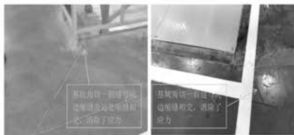
左图 基坑角部切割实例 右图 基坑角部切割缩缝实例