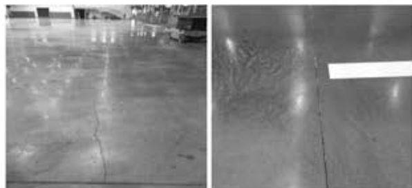
左图 缩缝切割不及时造成的裂缝 右图 切割时棱角保持比较好的缩缝

要尽可能的早些。同时，这也提醒我们，在温差有剧烈变化时，不应浇筑地坪砼，做好预防，有的放矢，是事半功倍的最好手段。