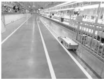
图 现代化工业厂房地坪

伴随着中国制造业的兴起,几万甚至上十万平方米的现代化大型工业厂房,现在已经比较常见。厂房地坪表面耐磨及光洁度处理的新技术也层出不穷,使厂房看上去光鲜亮丽,提高了工厂的生产环境。